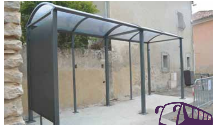
Installation en cours

Ce dernier permettra aux collégiens allant à Banon et aux lycéens du lundi matin pour Digne, d'attendre enfin dans de bonnes conditions et en toute sécurité leurs transports.